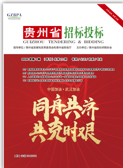
《贵州省招标投标》（季刊） 2020年第1期 总第22期