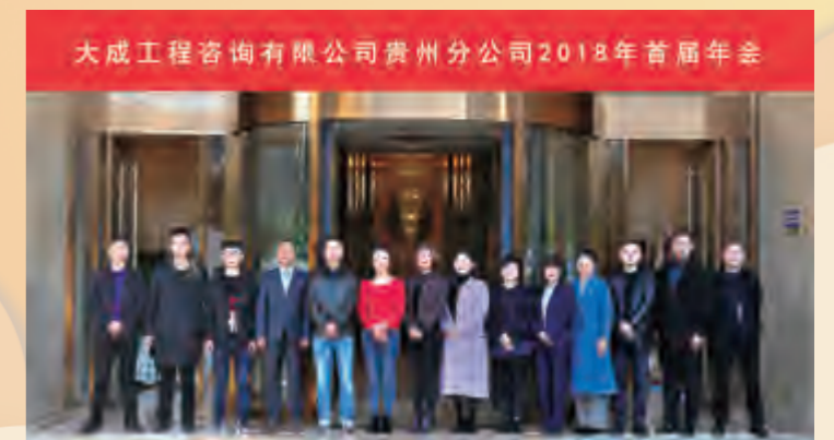
2019年1月兴义年会负责人留影