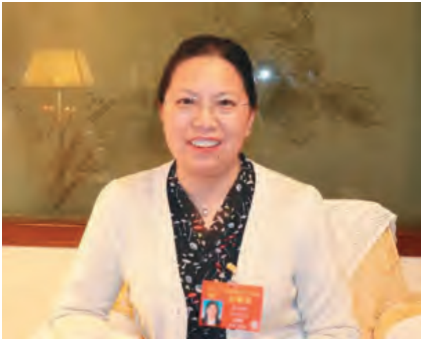
全国人大代表、贵州省财政厅厅长晏婉萍

“疫情防控”这个举国上下都关心和关注的问题，在今年的全国两会上，自然也成为了全国人大代表和政协委员热议的内容。全国两会期间，《政府采购信息》报记者也就贵州省如何做好疫情防控、相关制度应如何完善等问题采访了全国人大代表、贵州省财政厅厅长晏婉萍。