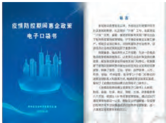
《疫情防控期间惠企政策电子口袋书》页面截图