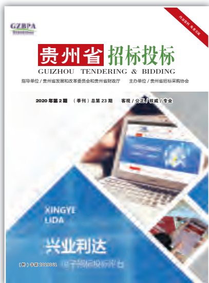
《贵州省招标投标》(季刊) 2020年第2期 总第23期

顾问: 李苏其 雷开慧 编委主任: 杨波 编委: 刘洪 龙启富 刘勤 廖文婕 石健昆 王京 屈圆 戚玉峰 吴青宸 执行主编: 徐妮 编辑: 罗东辉 熊晖 龙兴贵 电话: 0851-85285538 地址: 贵阳市瑞金北路136号中国华融中心12楼 邮编: 550001 电子邮箱: gztba@sina.com 准印证号: (黔)字第2019361 印刷: 贵阳快捷彩印有限公司 印数: 1000册 日期: 2020年6月 发送对象: 招标采购行业