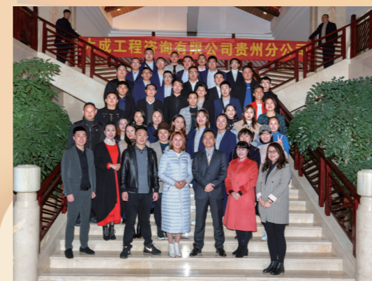
2020年1月云南年会留影

大成工程咨询有限公司贵州分公司将以卓越的管理、先进的理念、勇于开拓的精神，以诚取信，在未来的岁月里愿与各界朋友真诚合作，共谋发展，共创美好未来。