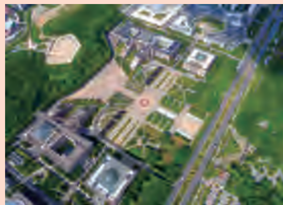
1. 贵阳市市级行政中心（贵阳市观山湖区标志性建筑，投资4亿元，岩溶发育场地，获得国家工程建设质量评审委员会颁发的“国家质量奖银奖”）