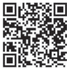
图为《疫情防控期间惠企政策电子口袋书》二维码。